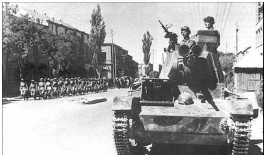
Советский танк Т-26 и подразделение РККА в иранском городе Тебриз 17 сентября 1941 г.

Иранский монарх Реза-шах Пехлеви ненавидел Англию за её диктат и не доверял СССР, в