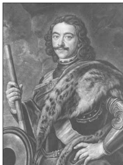
Пётр I Гравюра Б. Фогеля с оригинала Я. Купецкого. 1711 г.

В начале 1711 года по приглашению начальника русской артиллерии Питер Генри по-