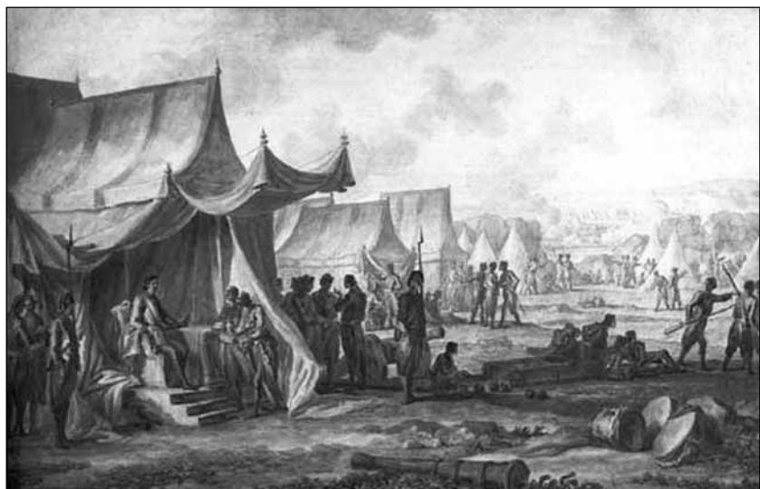
Пётр I (на реке Пруте) Художник М.М. Иванов, 1804 г.

На южных рубежах не были заранее созданы ни плацдарм, ни коммуникации, ни тыловая база. Параллельно с передислокацией войск на ходу, на скорую руку создавалась тыловая структура. Думается, никто из западноевропейских полководцев не пошёл бы на такой риск. Но был ли у Петра Великого выбор, когда на юге началась война?