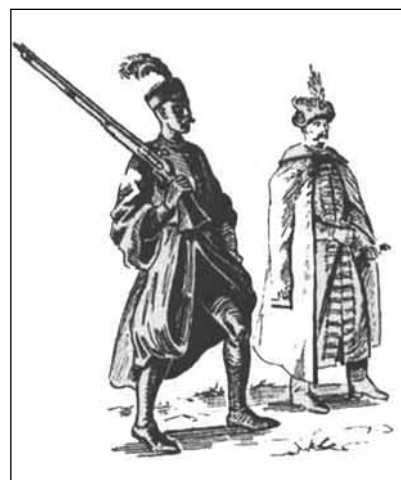
Жолнеры — польские пехотинцы XVII в.

В конце ноября 1632 года русские ратные люди Северной Украины получили из «государева Разряда» указ «с боем» посещать уезды Речи Посполитой, которые, как считало московское правительство, «были отданы к Литве на время» после Смуты. К таким причислялись уезды: Новгород-Северский, Трубчевский, Стародубский, Почепский и (в меньшей степени) Черниговский. Здесь, собственно, московским ратникам и велели «чинить» литовцам и полякам «задоры всякие», «промышляти, смотря по вестем и тамошнему делу». В наказах служилым людям Северной Украины особо предписывалось ни в коем случае не трогать православное население — «русских людей», относиться к ним благожелательно и ничем их не обижать: «приказывати к ним и писать тайно, чтоб они, помня Бога и православную крестьянскую веру, от литовских людей и от их мысли отстали, и государю добились челом, и крест целовали, и были в православной крестьянской вере под государевою высокою рукою по-прежнему» 5 . Строго запрещалось брать в качестве кре-