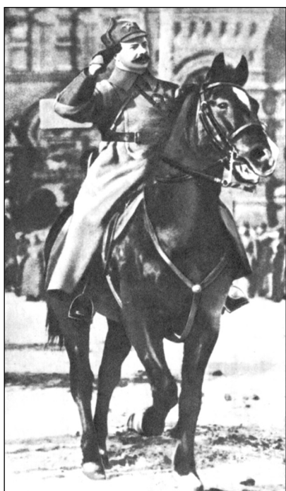
М.В. Фрунзе принимает парад войск на Красной площади 1925 г.