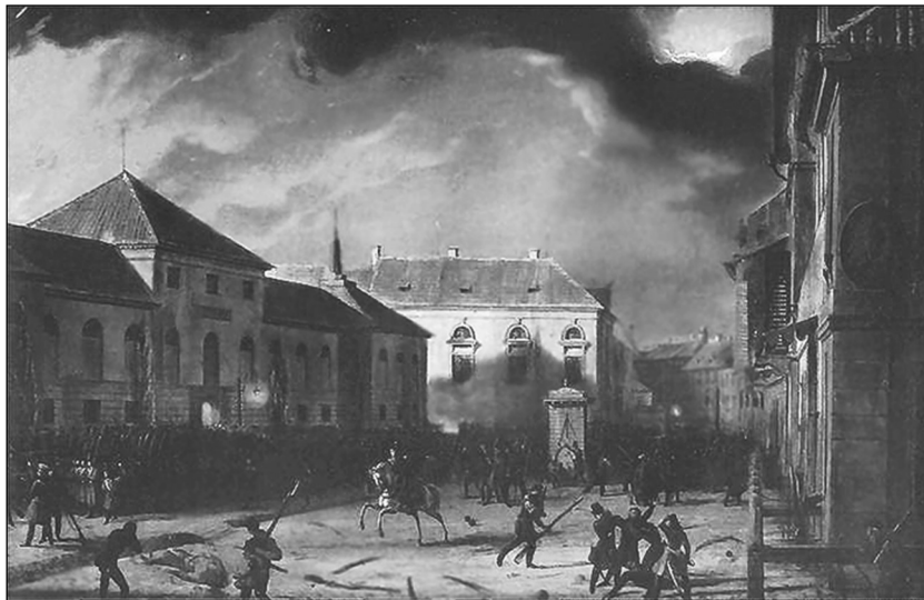
Взятие Варшавского арсенала Художник М. Залеский, 1831 г.

В конце XVIII века российскийское военное руководство, учитывая происходившие изменения международной обстановки, активно усиливало имевшиеся в стране крепости и создавало новые. При этом значительно возросла роль артиллерийского производства (артиллерийские дворы являлись его автономными центрами). Однако создать целостную систему крепостей для обороны Российской империи к началу Отечественной войны 1812 года так и не удалось. Следует отметить, что к этому времени не был реали-