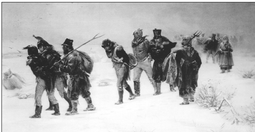
В 1812 году (отступающие французы) Фрагмент картины И.М. Прянишникова

слободе и составить подробные ведомости с указанием рода войск (кирасиры, драгуны, гусары, гренадеры, мушкетёры, егеря и проч.) и национальности (французы, итальянцы, пруссаки, вестфальцы, саксонцы, португальцы, испанцы, голландцы) каждого военнопленного, а также разделить их на взятых в плен в боях и на лиц, дезертировавших из «Великой армии». На офицеров следовало оформлять отдельные именные списки. К выполнению работы предполагалось привлечь чиновников, владевших иностранными языками 2 . Судя по этим документам, подавляющая часть пленных являлись французами, имелись также один итальянец, три саксонца, два пруссака, восемь вестфальцев, девятнадцать баварцев, десять поляков, тридцать кроатов 3 . Пленные офицеры служили в разных частях французской армии: подполковник Адольф Марбо и поручик Карл Брефо — в 16-м конно-егерском полку,