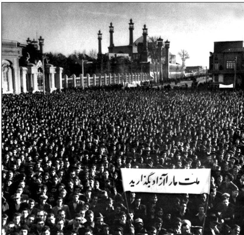
Одно из массовых шествий в поддержку национализации иранских нефтяных месторождений

4 октября последние служащие АИНК погрузились на британский крейсер «Маврикий» в порту Абадан и отплыли в порт Басру. «Этим самым... была порвана