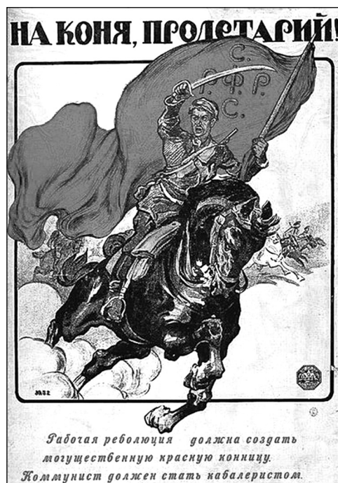
Плакат «На коня, пролетарий!»