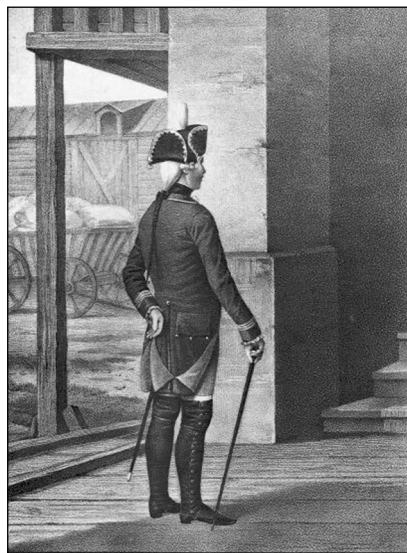
Нестроевой пехотного полка 1763—1786 гг.

Распределял присланных военных по монастырям епархии