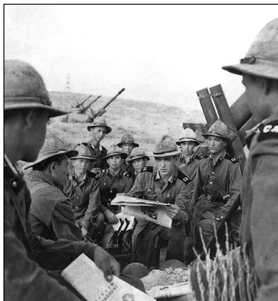
Советские солдаты в шлемах-панамках Афганистан

К концу 70-х годов XX века назрела необходимость в камуфлированной одежде, что называется, на каждый день. Особо остро в ней нуждались подразделения специального назначения Комитета государственной безопасности и пограничные войска. Новое хлопчатобумажное обмундирование из двухцветной камуфлированной ткани — мелкие квадраты жёлтого цвета на зелёном фоне — начало получать