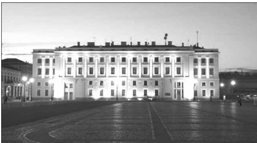
Штаб гвардейского корпуса

Возросшая опасность наполеоновского вторжения в пределы России побудила ускорить осуществление этой важной меры, и в январе 1812 года специальной комиссией во главе с военным министром было разработано и издано официальное руководство*** — «Учреждение для управления большой действующей армией» 2 . Согласно ему предусматривалось разделение каждой отдельной «частной армии» на корпуса и точно и подробно устанавливались штаты армейских, корпусных и дивизионных штабов. С назначением в марте М.Б. Баркляя-де-Толли главнокомандующим войсками 1-й русской Западной ар-