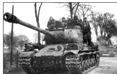
Тяжёлый танк ИС-2 на марше Германия, 1945 г.

Если сравнивать удельный вес различных типов бронетанковой