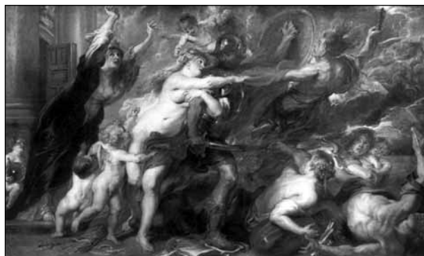
Бедствия войны Художник П. Рубенс, 1638 г.

Изучая многолетний опыт публикаторской и пропагандистской деятельности «ценителей Победы», нетрудно заметить, что их главное занятие — доводить до читателей