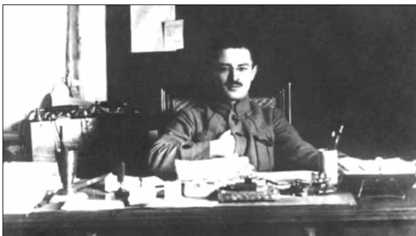
Заместитель председателя Революционного военного совета в 1918—1924 гг. Э.М. Склянский

К ОЛИЧЕСТВО бывших офицеров в РККА к началу 1921 года долгое время оценивалось по-разному, так как установление