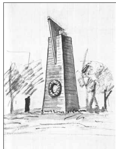
Вариант проекта памятника героическим защитникам Ленинграда Автор И.М. Чайко 1942—1943 гг.

После прошедшего в 1971 году так называемого заказного конкурса принимается решение об