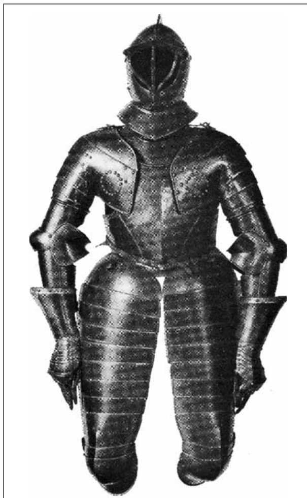
Доспехи кирасира Германия, первая половина XVII в. Из собрания музея Германской истории

В их задачу входило лобовой атакой пробивать оборону противника. Для этого кирасиры имели пусть и не столь хороших, как у прежних рыцарей, но достаточно массивных лошадей, практически полный набор защитного вооружения, полностью закрывавший голову, туловище, руки и пе-