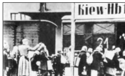
Оккупанты угоняют жителей Киева на работы в Германию

В 1933 году в Германии были созданы первые концлагеря, в которых практиковалось перевоспитание трудом. Политических противников нацизма заставляли выполнять тяжёлую, часто бессмысленную и унижительную работу (например, чистить зубными щётками плац в лагере). Всему миру стала впоследствии известна надпись на воротах многих концлагерей (например, Освенцима и Зак-