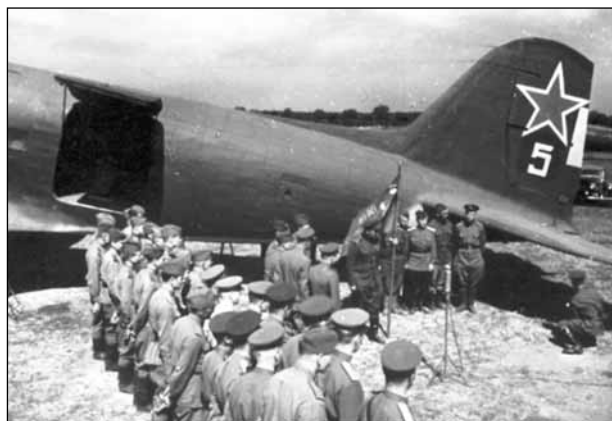
Лётно-технический состав перед перебазируанием на новый аэродром

Так, например, в отчётах отдела аэродромного строительства (ОАС) 3-й воздушной армии (1-й Прибалтийский фронт) за два последних года войны отмечалось, что сроки подготовки к предстоявшей операции колебались от 6 месяцев в Витебско-Полоцкой до 10 дней в Мемельской наступательных операциях 2 . Поэтому в первом случае сроки подготовки позволяли выполнять задачу батальонами по строительству и изысканию аэродромов последовательно. Отдельные инженерно-аэродромные батальоны (оиаб) работали в полосе границ своих районов авиабазирования под руководством отделов аэродромного строительства. В такой ситуации была