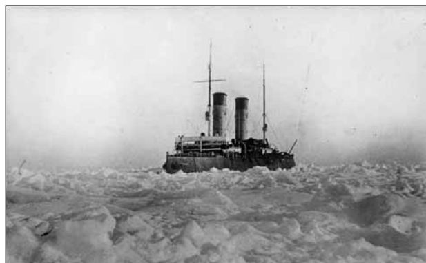
Ледокол «Красин» в Баренцевом море