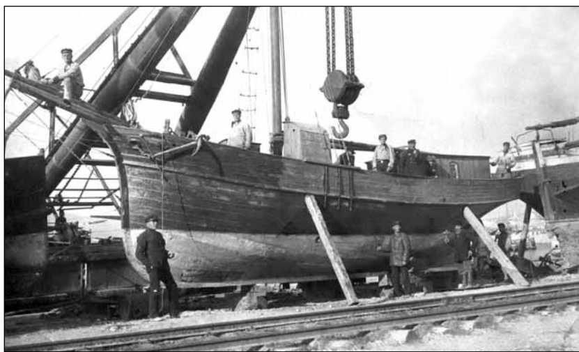
Моторно-парусная шхуна Новороссийского морпогранотряда 1930-е гг.

В апреле 1924 года состоялось Всесоюзное совещание начальников пограничных частей, которое в своей резолюции в отношении охраны морских границ предложило «отрядные объединения сохранить. Отряды как административные единицы подчинить непосредственно начпогранчастей... Судовой состав расщедоточить, передав в оперативное подчинение прибрежных отрядов» 2 . В соответствии с приказом ОГПУ от 12 мая 1924 года черноморские отряды морпогранохраны были расформированы с прикреплением имев-