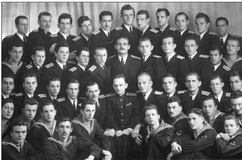
1-й курс обучения югославской спецгруппы 1947 г.

С 1 февраля начались подготовительные занятия. В свободное от них время