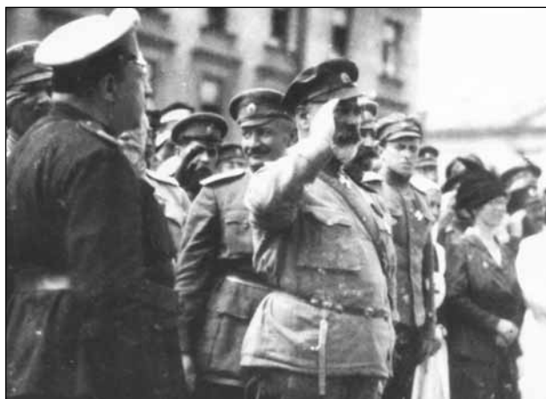
Генерал А.И. Деникин принимает парад (слева — командующий Добровольческой армией генерал-лейтенант В.З. Май-Маевский) Лето 1919 г.

Основой Добровольческой армии (ДА), возникшей на Дону в конце 1917 года, было офицерство, которое наряду с учащейся молодёжью и казаками вошло в состав малочисленных добровольческих полков, в феврале 1918 года выступивших в Первый Кубанский поход. Добровольцы-«первопоходники» 3 принимались на службу после заключения 4-месячного контракта с армией. Но уже в скором времени нехватка офицерских кадров, вызванная большими потерями и увеличением числен-