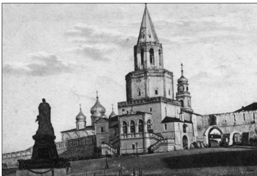
Спасская военно-кремлёвская церковь до 1910 г. Слева памятник Александру II

Таким образом, Казань и её гарнизон остались по сути без военной церкви. В связи с этим казанский архиепископ Иона направил в Святейший Синод список церквей, которые могли бы быть переданы в военное ведомство: это не имевшая прихода Кремлёвская Спасская церковь, Екатерининская церковь в Адмиралтейской слободе и Варваринская церковь. Синод, рассмотрев все варианты, решил, что наиболее приемлемым является передача под начало обер-священника армии