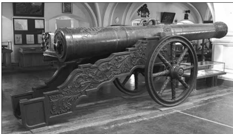
Ствол 68-гривенковой пищали «Инрог», отлитой мастером Андреем Чоховым в 1577 г. Лафет бутафорский XIX в.

Направляясь к императору Леопольду I в Вену, царь посетил сильную пограничную крепость Кёнигштейн, находившуюся на левом берегу Эльбы в так называемой Саксонской Швейцарии. Осмотр крепости Пётр начал с посещения цейхгауза, где немецкий князь Э. Фюрстенберг подробнейшим