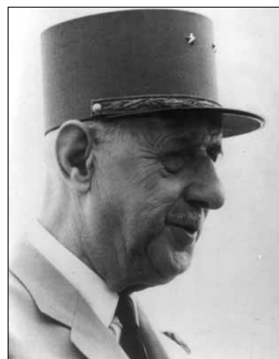
Шарль де Голль в разные годы жизни

Б РИГАДНЫЙ генерал Шарль де Голль (Charles de Gaulle) родился 22 ноября 1890 года в Лилле в аристократической семье. В 1912 году окончил знаменитое военное училище Сен-Сир и начал военную карьеру. Участник Первой мировой войны. Попал в плен к немцам и в 1916 году содержался в одном лагере, даже проживал вместе в одной комнате с будущим Маршалом Советского Союза М.Н. Тухачевским 3 . В июле—августе 1920 года, будучи в чине майора, принимал участие в Советско-польской войне на стороне Польши. В межвоенный период проявил себя как незаурядный военный теоретик, сторонник активного применения танков в ходе боевых операций. Некоторые его книги были опубликованы в 1930-е гг. в СССР в переводе на русский язык. Однако на практическом военном поприще к началу Второй мировой войны де Голль смог дослужиться лишь до полковника. Генеральское звание получил в начале войны, после назначения командиром танковой дивизии 4 .