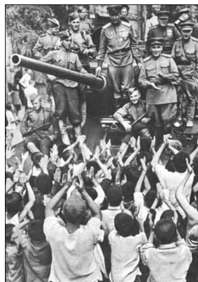
Жители китайского города Далянь (Дальний) встречают советских танкистов 24 августа 1945 г.

Перешедший под совместное управление Китая и СССР порт Дальний считался в то время самым крупным торговым портом в бассейне Жёлтого моря и вторым по величине (после Шанхая) китайским торговым портом в этой части Тихого океана. Военное значение Дальнего определялось тем, что он мог служить базой ремонта и пунктом базирования кораблей, конвоирующих суда с войсками и военными грузами на коммуникациях Жёлтого моря. Этот порт можно было использовать для материального обеспечения ВМБ Порт-Артур, а также посадки войск на суда или их высадки с моря для дальнейшей транспортировки по железным дорогам вглубь Северо-Восточного Китая. В случае войны на Дальний должен был распространяться режим военно-морской