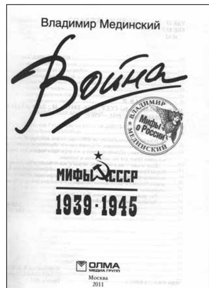
Титульный лист книги

И это следовало написать. Конечно, многие прибалтийцы идеализировали социализм в СССР и советскую власть, как это делали их известные интеллектуалы в Западной Европе, как в горбачёвском СССР идеализировали западную демократию. Однако даже такие иллюзии прибалтийцев базировались на фундаменте двухсот сравнительно спокойных и благополучных лет в составе единого Российского государства. Российская империя не лишала прибалтийцев независимости, они утратили её раньше, под