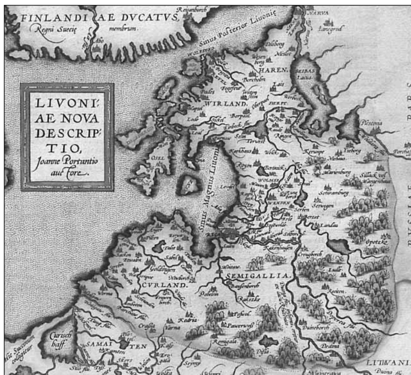
Карта Ливонии из атласа А. Ортелиуса XVI в.

С X по XII век эта земля по праву принадлежала Новгородской боярской республике. Новгородцы