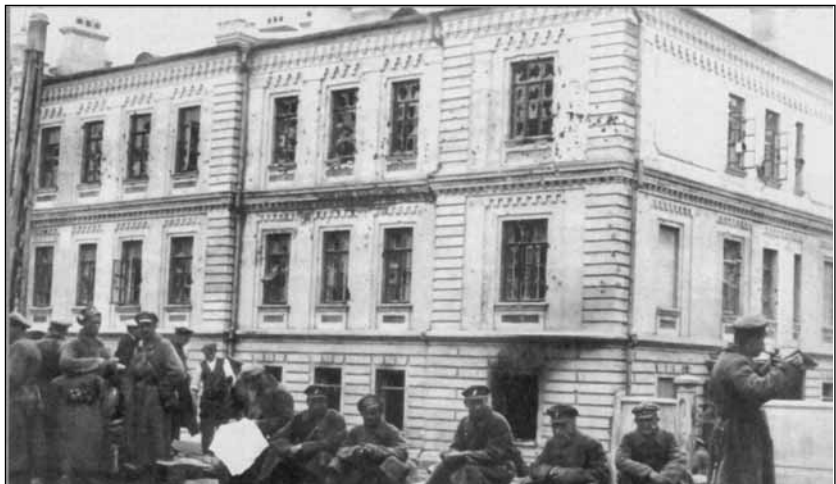
Чешские легионеры после уличного боя

Несмотря на различия подходов, историки советской школы и эмигранты сходятся в том, что заинтересованности в участии в Гражданской войне у военнослужащих Чехословацкого корпуса не было. Об этом, в частности, свидетельствует заявление бойцов и командира 3-го чехословацкого полка в Челябинске: «Никогда не пойдём против советской власти... Не верьте никому, кто будет говорить, что чехи — враги русского народа» 5 . Однако усилиями представителей военно-политических кругов Франции и Великобритании корпус был втянут в орбиту войны. Чехословацкий государственный деятель Э. Бенеш вспоминал: «Наша армия в России для союзников являлась лишь