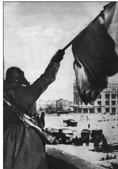
Красное знамя победителей в Берлине Май 1945 г.

После образования Советского Союза существенно изменилась государственная символика, а в ходе военной реформы 1924—1928 гг. — нумерация и наименования многих войсковых формирований. Прежние знамёна устарели, однако лишь 11 июля 1926 года было принято Положение «О революционных Красных знамёнах частей Рабоче-крестьянской Красной армии» и утверждены образцы знамён.