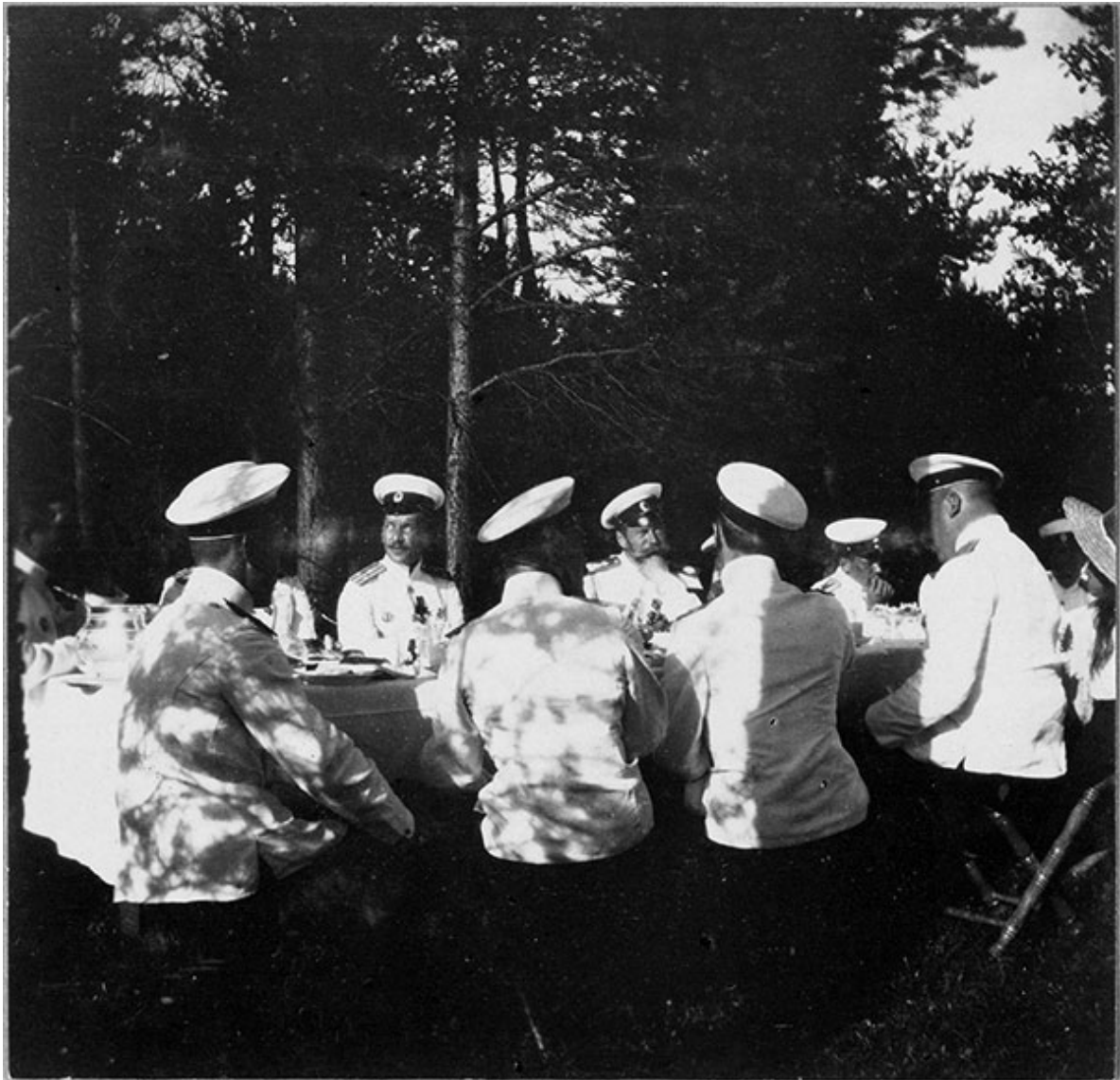
Николай II (справа, с траурной повязкой на кителе) за столом с офицерами-морьяками. Финляндские шхеры, 1913 г.

Если говорить о дневниках Николая II, приведём две небольшие цитаты. 6 августа 1904 года: «Погода была безотрадная, лил дождь и дуло. Преображенский праздник, тем не менее, удался. Парад полку и всей гвардейской артиллерии был блестящий; почва также, но от воды. Объехав все столовые нижних чинов и порядочно нагрузившись водкой, доехал до офицерского собрания. Здесь был большой завтрак с многочисленными гостями» 4 . Отметим, что в столовых нижних чинов император «по должности» опрокидывал «военную» чарку за здоровье своих солдат. При этом «рабочий день» у царя продолжался до позднего вечера.