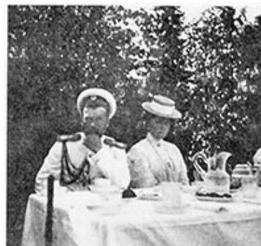
Николай II и императрица Александра Фёдоровна на пикнике с офицерами императорской яхты «Штандарт». Финляндские шхеры, остров Патио, 1913 г.

История этой чарки следующая. Когда в 1905 году страна пошла «вразнос», то после короткого периода уступок, с весны 1906 года Николай II начал постепенно «закручивать гайки», назначив П.А. Столыпина министром внутренних дел. Министр крови не боялся и террористов начал вешать. Сам же царь с начала 1906 года регулярно проводил смотры гвардейских полков, которые служили непосредственной опорой царской власти. Как правило, после прохождения полка государь устраивал торжественный обед и для нижних чинов, и для офицеров полка. Во время обеда, естественно, выпивалось, и не единожды. Поэтому на монете и поминаются «смотры 1906 г.».