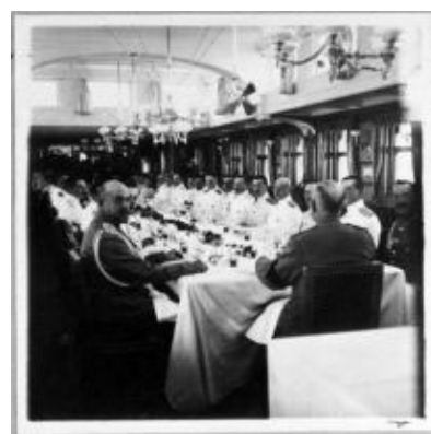
Обеденный салон императорской яхты «Штандарт»

Все когда-либо служившие в армии на офицерских должностях прекрасно помнят душевные офицерские «корпоративы». Эти «мероприятия» обязательно связаны с употреблением спиртного и носят внеслужебный, неофициальный характер. В царской России эта традиция также существовала, но «обставляли» её несколько по-иному.