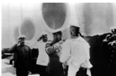
Водочная проба на императорской яхте

В 1874 году, когда праздновалось столетие лейб-гвардии Гусарского полка, ювелиру А.В. Любавину поручили изготовить как для офицеров, так и для императора целую партию небольших серебряных чарок для полковых посиделок. Каждая чарочка в миниатюре повторяла форменный кивер лейб-гвардии Гусарского полка, причём чеканщики настолько точно смогли передать фактуру меха, узорчатой ткани и перьев султана, что не верилось, что всё выполнено из металла 10 . Одну из этих чарок офицеры поднесли императору Александру II, который с апреля 1818 года по март 1881 года являлся шефом полка.