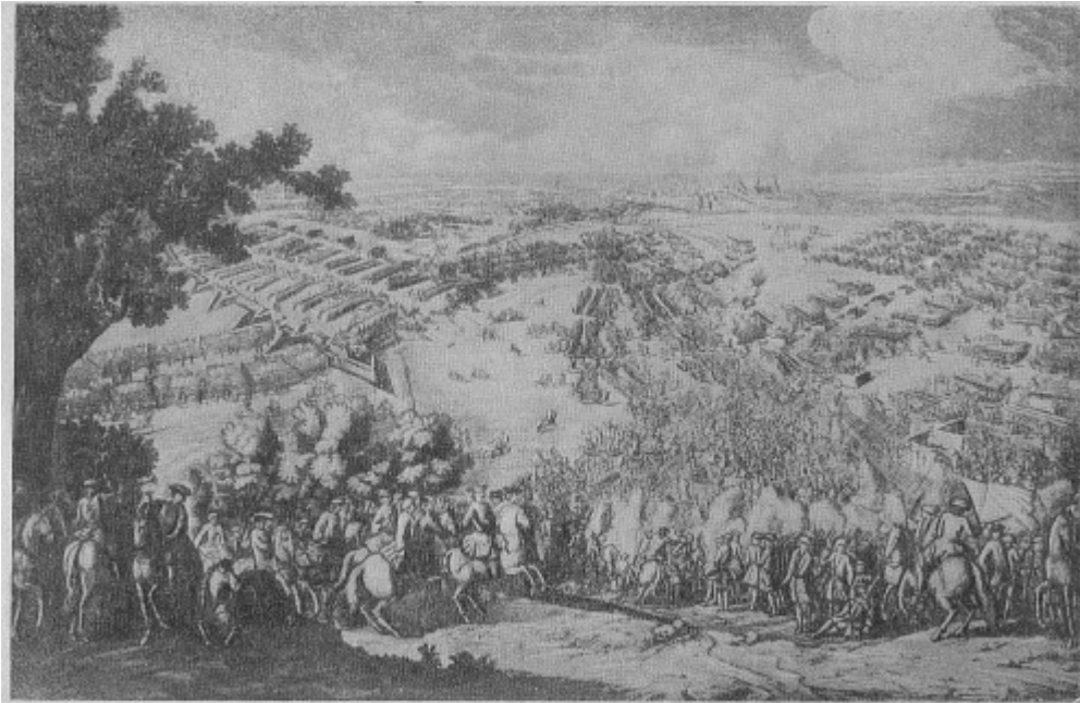
„Изображение прославной баталии между войск российских и шведских... учинившейся неподалеку от Полтавы июня в 27-й день 1709”. Картина Бартоломео-младшего, исполненная по указанию Петра I.

26 июня Петр произвел смотр пехотным полкам и «изволил расписать по дивизиям, из которых первую царское величество своею персоною изволили принять в правление, а прочие разделил по генералитету». Но «фельдмаршал и генералитет просил его царское величество, чтоб баталию не преобщаться, на что изволил сказать, чтоб о том ему не говорили» 6 .